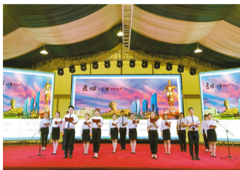
“窗口”的工作思路，力图通过文化建设，推动向国际现代化大型企业集团稳步迈进的步伐。