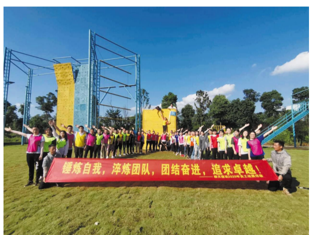
《企业文化建设》专题培训会。

下午的活动为“挑战毕业墙”，是以参加的全体员工为一个整体进行挑战，顺天建设精英团队克服重重困难，圆满的完成了任务，并在集团各个分子公司内以人数最多、时间最短通过了挑战，顺天建设的挑战成绩高高地写在了毕业墙上。