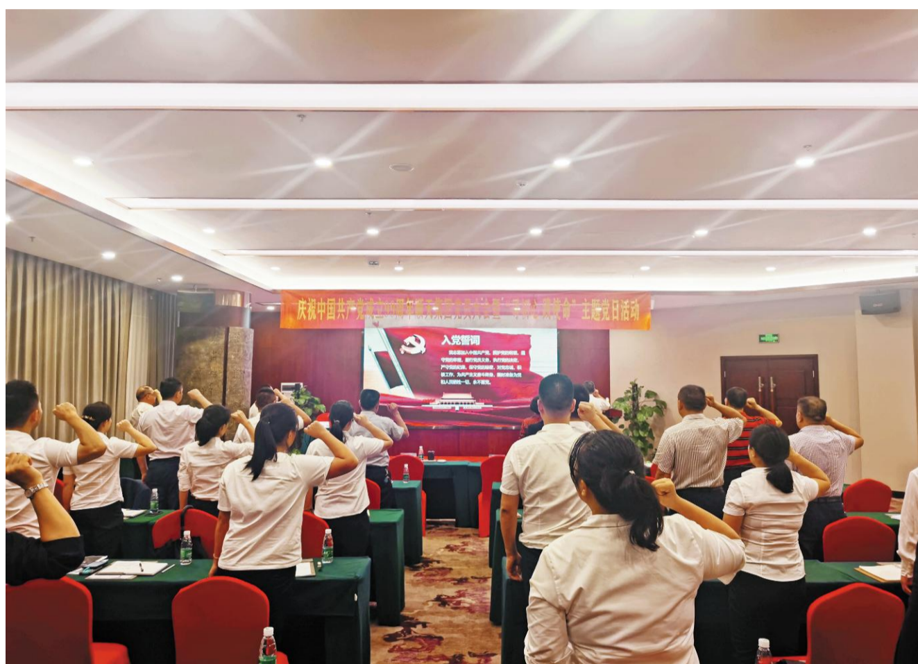
2020年6月30日下午,顺天集团全体党员在庆祝中国共产党成立99周年党员大会上庄严宣誓。

全管理,认真落实安全生产责任制,遵守安全生产规章制度,增强工作的责任感,要切实做好施工安全防护及施工人员安全教育培训工作,提高安全意识,确保安全生产“零事故”。