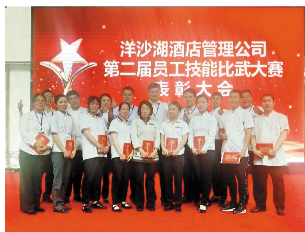
旅游公司酒管板块第二届员工技能比武大赛获奖者合影。

“中式标准摆台”和“客房中式铺床”同时考验选手实际操作的娴熟度、标准化和效率，这可不是一時半会临时抱佛脚能学来的，需要长期以往地不断操练、用心练习而取得的内功。“前台入住办理”考验的是前台接待员在接待客人进行入住手续办理时，是否能熟悉酒店各项产品知识，是否能从容应对客人提出的各项问题。