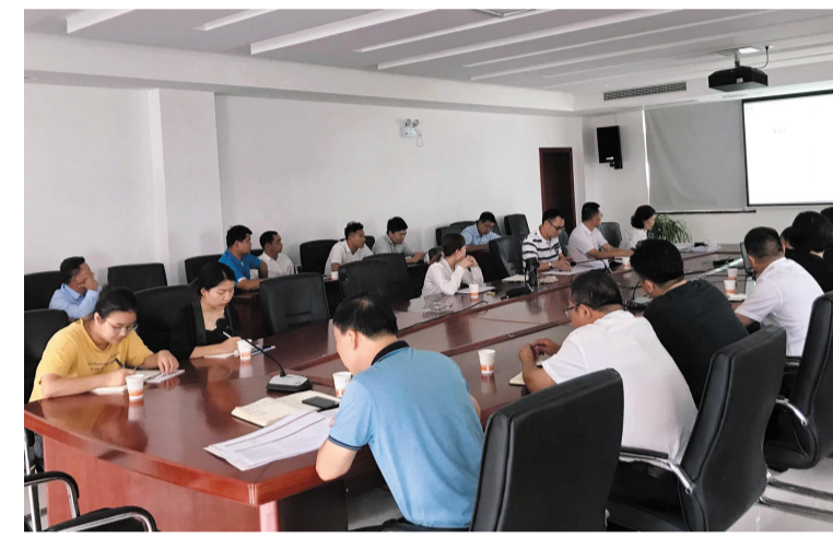
2020年6月24日,洋沙湖旅游景区创4A提升规划专题汇报会在管理中心108会议室召开。