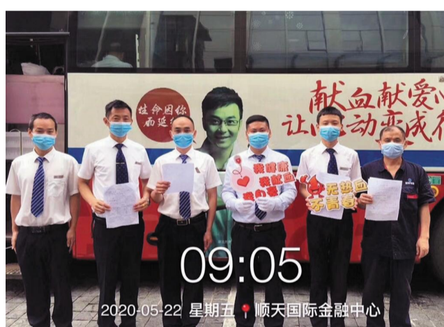
顺时物业参与献血的爱心人士。