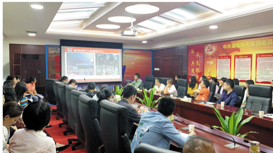
建设公司消防安全知识培训图。