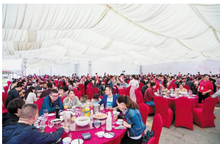
洋沙小镇2020一见如故，中秋家宴会场。