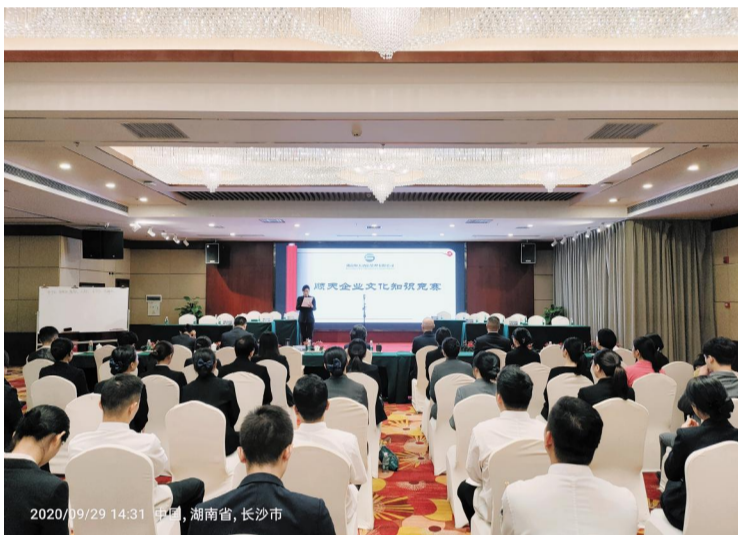
2020年10月14日，酒管公司组织下属三家酒店在黄金海岸大酒店举办企业文化知识竞赛。