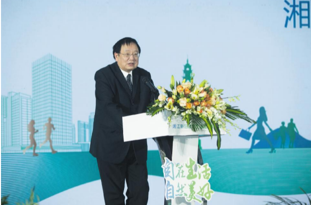
湖南省政府经济规划专家、湖南师范大学教授、博士生导师朱翔对湘阴纳入湘江新区整体规划建设后的定位进行解读。