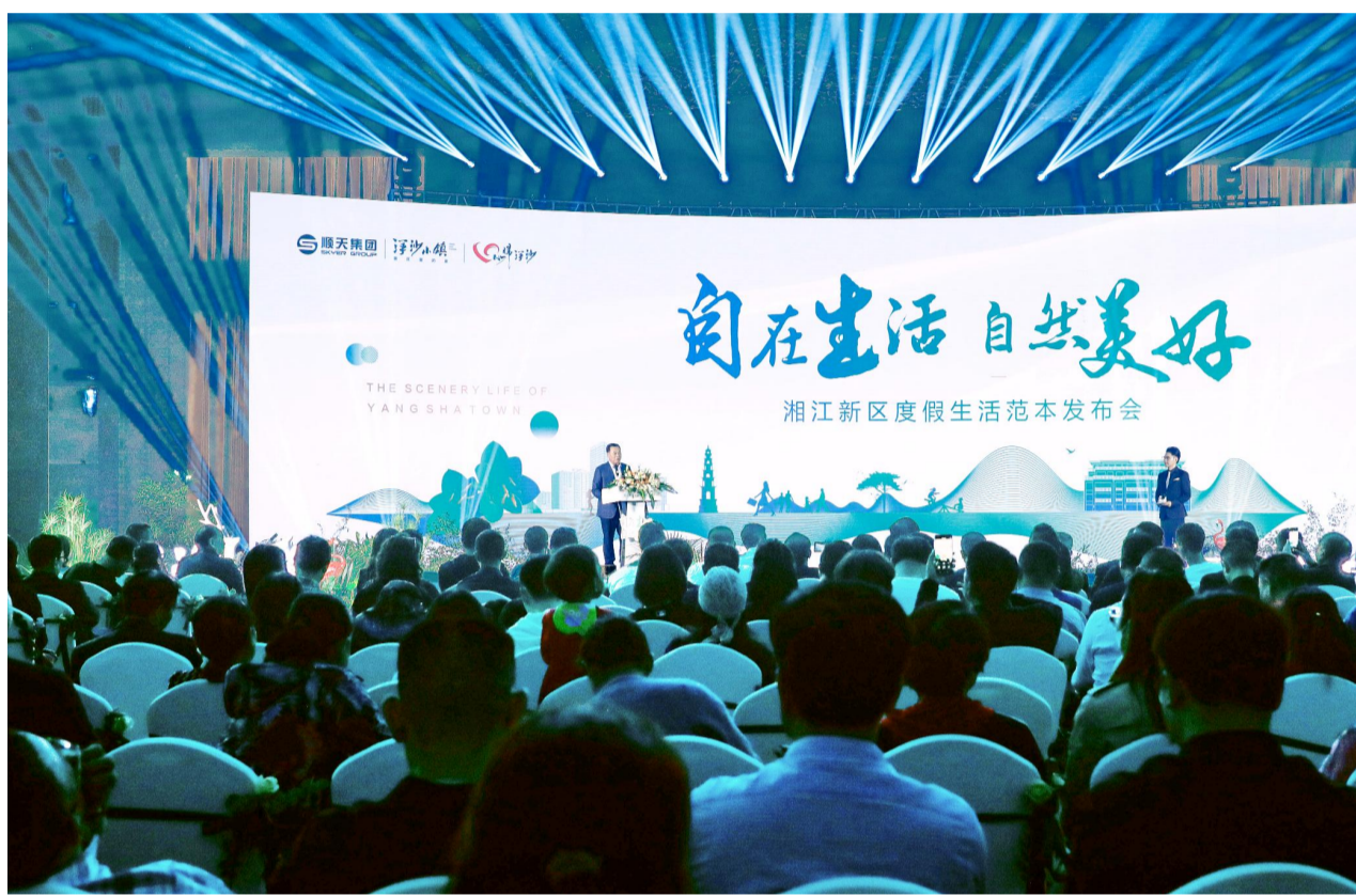
11月7日,主题为“自在生活·自然美好”的洋沙小镇·湘江新区度假生活范本发布会在顺天·凯宾斯基酒店举行。

【本报讯】11月7日,主题为“自在生活·自然美好”的洋沙小镇·湘江新区度假生活范本发布会在顺天·凯宾斯基酒店举行。顺天集团·洋沙小镇作为湘江新区度假生活方式倡导者,与来自湖南各界的精英、主流媒体、洋沙小镇业主代表一道,开启湘江新区全新度假生活方式。