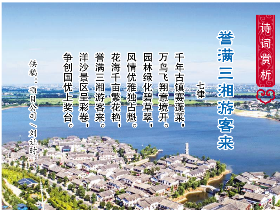
诗词赏析 誉满三湘游客采